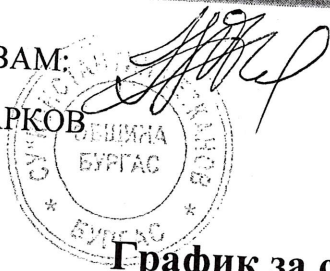
График за стол – обедно хранене