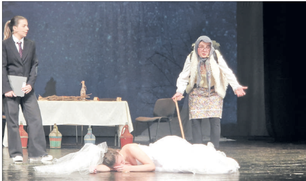
Тази година Немската гимназия в Бургас навършва 65 години. Началото на празничните събития е дадено с театралната постановка „Балкански синдром“