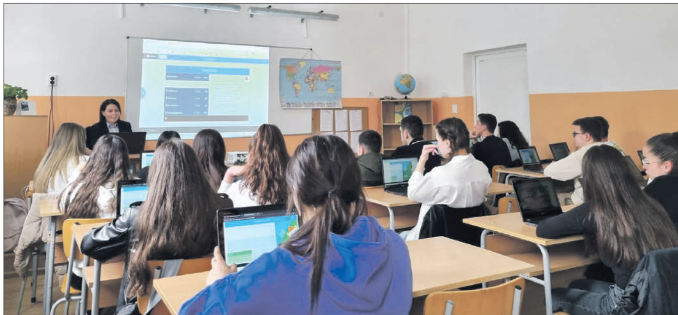
Учениците имат постоянен достъп до електронни учебни ресурси и възможност за самостоятелно учене и учене в сътрудничество