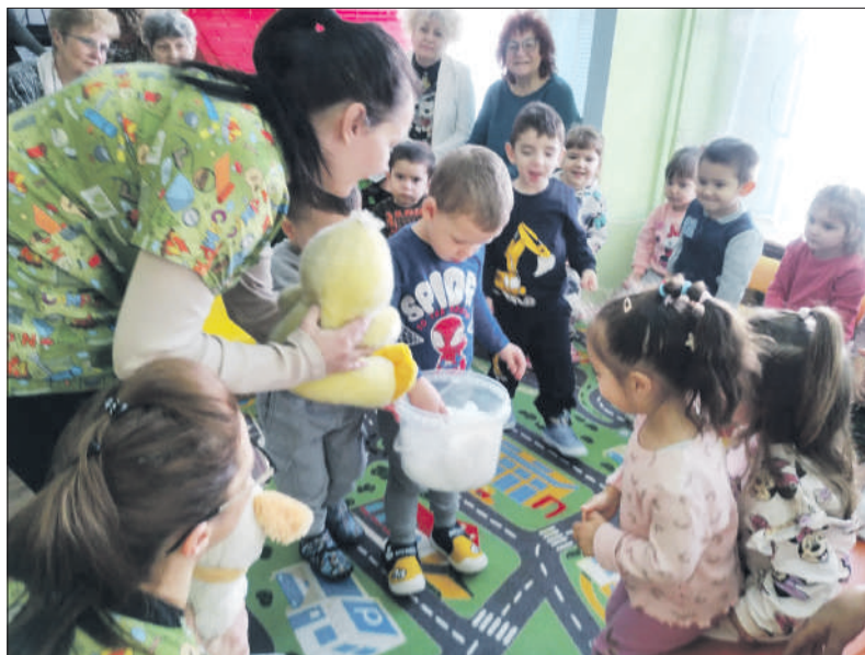
Деца с нетърпение очакват своята нова утринна история