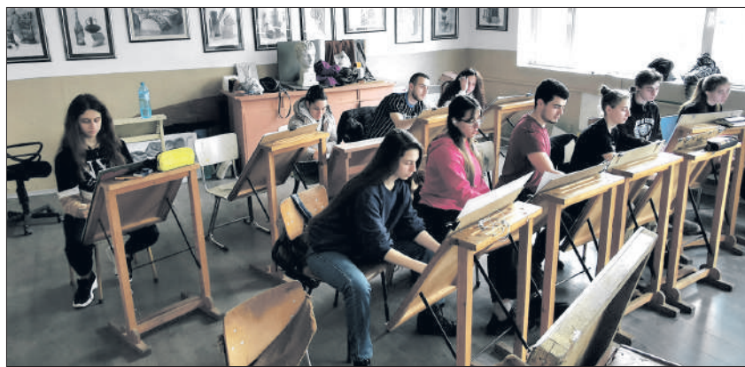
Националното училище за приложни изкуства е търсено от ученици и родители