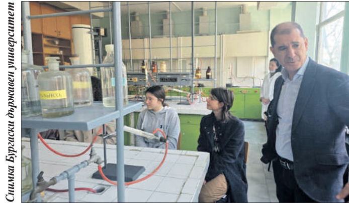
Проф. Сотир Сотиров присъства на едно от първите занятия в лабораториите на Бургаския държавен университет

Проф. Сотиров отбелязва, че често училищата не разполагат с добра техника, така че курсовете предоставят на учениците ценна възможност да се запознаят с работата на учените