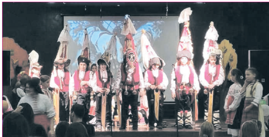
Третокласниците пресъздават дълговежни традиции на дедите ни

Учениците направиха и наричане за здраве и берекет на цялото семейство. След това всички прескочиха огъня, за да прогонят зимата и годината да бъде плодородна.